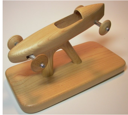
Bestell-Nr. fan 20 DSKD-SENIOR-Holzmodell auf Ständer Handarbeit, Länge 21,5 cm

NUR AUF BESTELLUNG, ca. 3 Wochen Lieferzeit