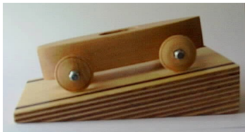
Bestell-Nr. fan 15 DSKD-JUNIOR-Holzmodell auf Rampe Handarbeit, Länge 10 cm