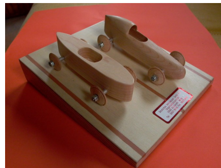
Bestell-Nr. fan 21 DSKD-Doppelrampe mit je 1 JUNIOR- u. SENIOR-Holzmodell , 11 cm Handarbeit