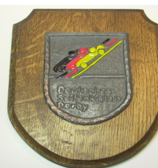
Bestell-Nr. fan 22 Ehrenpreis DSKD-Wappenteller , handcoloriert