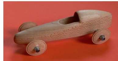
Bestell-Nr. fan 17 DSKD-SENIOR-Holzmodell Handarbeit, Länge 11 cm