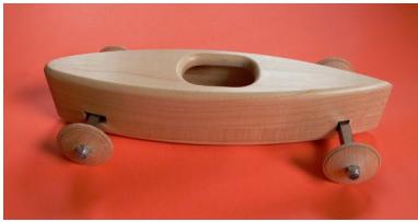
Bestell-Nr. fan 14 DSKD-JUNIOR-Holzmodell , Handarbeit, Länge 10 cm