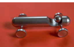
Bestell-Nr. fan 23 DSKD-Seifenkiste , Stahl lackiert Länge: 7,5 cm